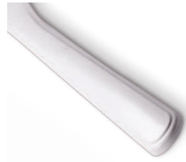
rille til ekstra stabilitet