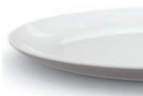
Glat til optimal rengøring